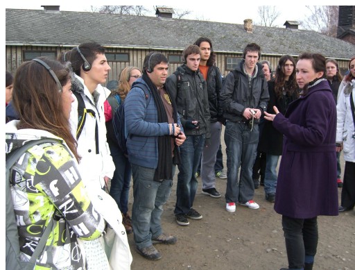
A visita a Auschwitz tem muito impacto sobre todos

O dia termina com a visita à bela cidade de Cracóvia .