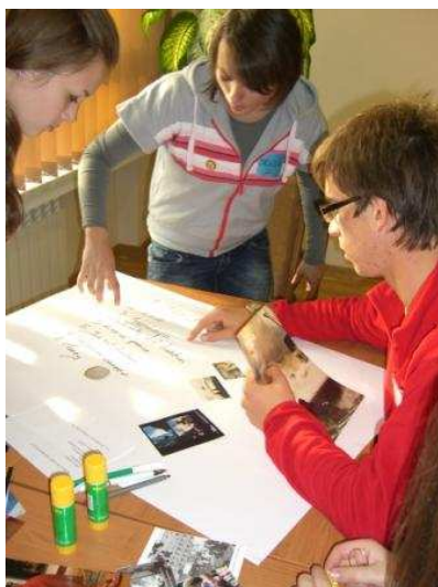
Trabalho de grupo na Escola Secundária em Ceciny

Visita à Escola Secundária de Ceciny. Participamos em actividades de integração juntamente com um grupo de alunos dessa escola, é-nos servido um lanche e somos desafiados para uma actividade que fomenta a partilha dos alunos dos quatro países sobre diversos aspectos da cultura de cada país.