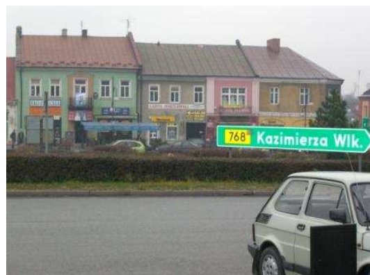
A cidade de Jędrzejow parece-nos cinzenta...