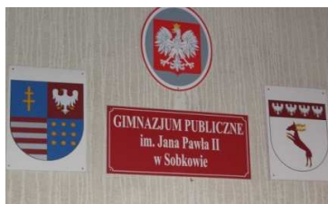
O nome da escola evoca o Papa João Paulo II

Às 8h30, numa reunião de alunos e professores no corredor, o director dirige-nos calorosas palavras de boas-vindas. A seguir, os alunos têm a oportunidade de conhecerem melhor a escola e de estabelecerem primeiros laços entre si através de diversas actividades de integração , animados por professores polacos.