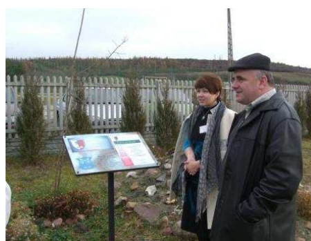
Uma "aula" de História para os professores visitantes, ao lado do carvalho em memória das vítimas de Katyn