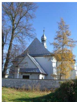
A igreja de Sobkow