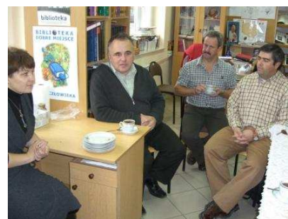
O director a explicar-nos o funcionamento da escola como também o seu contexto geográfico e histórico

Os professores visitantes são guiados à Biblioteca para uma reunião informal com o Director . São-nos oferecidos café, chá e doces enquanto o director nos explica o funcionamento da escola, o sistema educativo da Polónia, o meio em que a escola se insere e como esta procura responder aos desafios por ele colocados. Fala-nos também da história da vila de Sobkow, com especial incidência na época da ocupação alemã, durante a II Guerra Mundial.