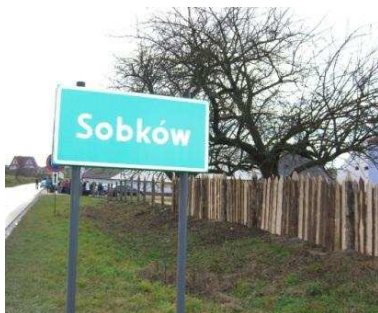
Sobkow é uma pequena vila