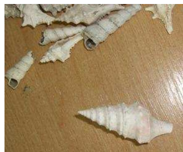
Fósseis encontrados em Sobkow

Ainda antes do almoço, o director guia todo o grupo numa visita a Sobkow . Visitamos os correios (cada aluno recebe um postal, uma caneta e uma sorriso da funcionária!), a igreja, o parque e somos recebidos pelo vice-presidente da Junta de Freguesia que destaca a importância do projecto Comenius para Sobkow, pois este ajuda a dar uma cara à Europa e estabelecer laços. "É importante recebermos fundos da UE para podermos tratar do saneamento básico, mas é pelo menos tão importante estabelecermos relações com pessoas e instituições de outros países europeus", afirma este autarca, elogiando o empenho da escola neste projecto e a nossa disponibilidade para participarmos!