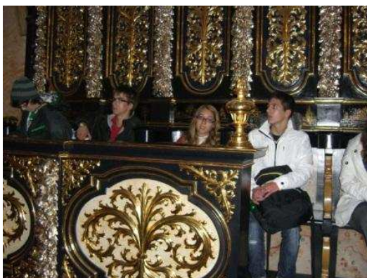
Na igreja do convento em Jędrzejow

14h00: Visita a Jędrzejow , pequena cidade a cerca de 20 km de Sobkow. Talvez devido ao tempo frio e cinzento desta tarde e ao anoitecer muito cedo (às 16h00 horas já está escuro), esta cidade parece-nos ter parado no tempo, com poucas alterações desde a mudança de sistema em 1989. Por volta das 19h00, visitamos o convento cisterciense dessa cidade, com um dos maiores órgãos de tubo da Polónia, deveras impressionante.