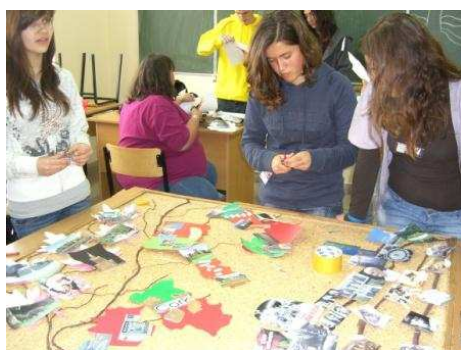
Os alunos colaboram na construção duma árvore europeia.

Enquanto os alunos começam a trabalhar no projecto da árvore, os professores, de novo na biblioteca, tratam de questões burocráticas do intercâmbio (contas, pagamentos, certificados, etc.). Um pouco mais tarde, são convidados a juntarem-se junto dum carvalho no jardim da escola. Este foi plantado recentemente, em memória do massacre de Katyn, na II Guerra Mundial, e, ao mesmo tempo, da morte de vários membros do governo polaco num acidente de aviação, precisamente na deslocação a Katyn, para evocar esta data. Recebemos uma lição pormenorizada sobre a História da Polónia, com especial enfoque nestas datas trágicas.