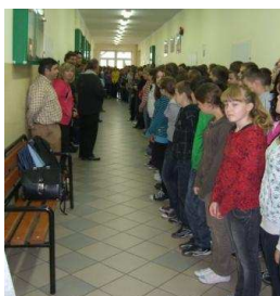
Uma reunião no corredor